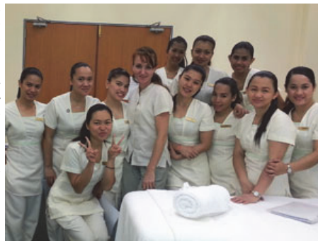
[La Redaction - www.emotionspa-mag.com ] 05/03/2014

Associées au déroulé spécifique, modulable selon les besoins de chaque cliente, ces dernières pourront doublement profiter de ce moment privilégié, en toute confiance et sérénité. » Gaëlle Le Corre