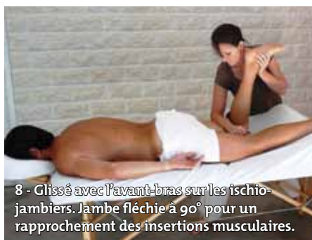
8 - Glissé avec l'avant-bras sur les ischio-jambiers. Jambe fléchie à 90° pour un rapprochement des insertions musculaires.