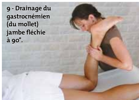
9 - Drainage du gastrocnémien (du mollet) jambe fléchie à 90°.