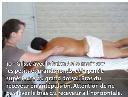
10 - Glissé avec le talon de la main sur les petits et grands ronds, et la partie supérieure du grand dorsal. Bras du receveur en antépulsion. Attention de ne pas lever le bras du receveur à l'horizontale.