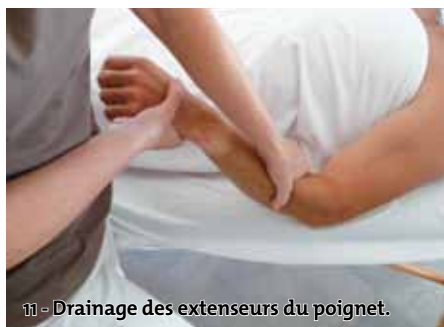
11 - Drainage des extenseurs du poignet.