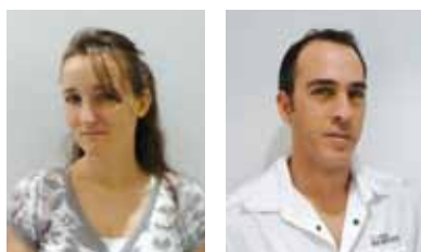
PAR GAËLLE LE CORRE ET DANIEL PARÉ

Le massage suédois n'est pas un simple massage relaxant comme on le pense souvent. Il apporte non seulement une détente psychologique, mais aussi une relaxation musculaire profonde. C'est un massage extrêmement riche en techniques, manœuvres et variantes. Implanté en Amérique au début du XX e siècle, le massage suédois est aujourd'hui encore essentiellement enseigné au Canada et aux États-Unis où sa maîtrise requiert 450 heures de formation.