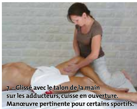
7 - Glissé avec le talon de la main sur les adducteurs, cuisse en ouverture. Manœuvre pertinente pour certains sportifs.