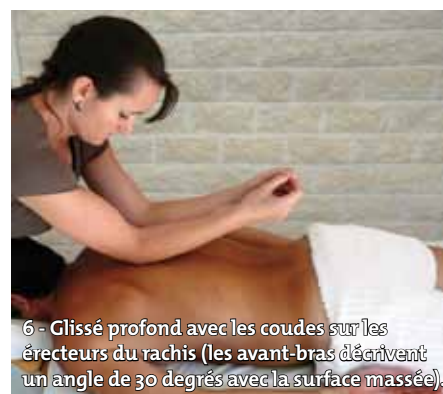
6 - Glissé profond avec les coudes sur les érecteurs du rachis (les avant-bras décrivent un angle de 30 degrés avec la surface massée).