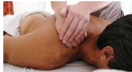
3 - Friction circulaire sur le trapèze supérieur avec la pulpe des doigts, mains superposées.